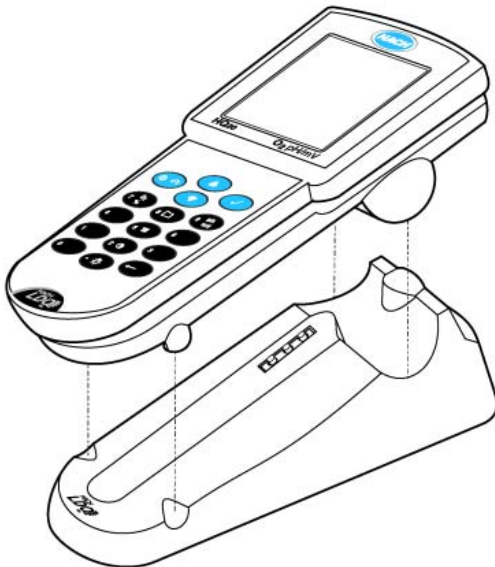
图 1 使用电源座