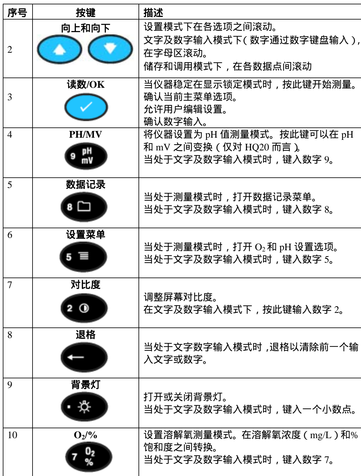
表 2 按键及描述 (继续)